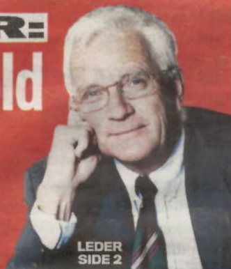
LEDER SIDE 2