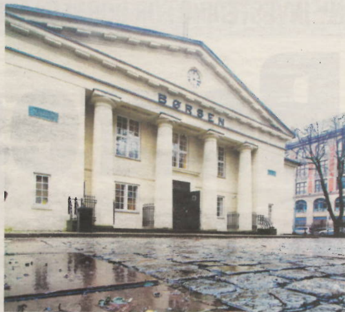
NEDTUR: Oslo Børs' hovedindeks falt mer enn de store europeiske indekser i går.

Det selskapet har sett, er at noen av svulstene det injiseres i blir borte, mens andre krymper.